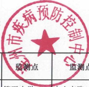
连州市用户水龙头水质监测信息公开表（2023年第一季度3月份市政管网供水）