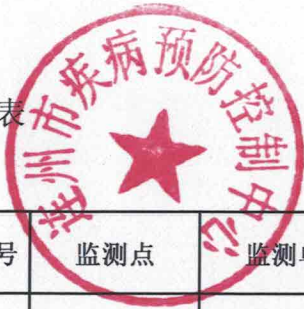
连州市用户水龙头水质监测信息公开表（2023年第一季度乡镇管网供水）