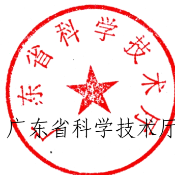
广东省科学技术厅